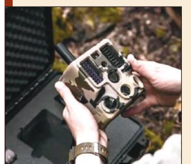
Turkish AI defense firm secures investment at valuation of $12.5M