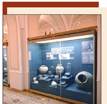
Глубже узнать многовековое наследие