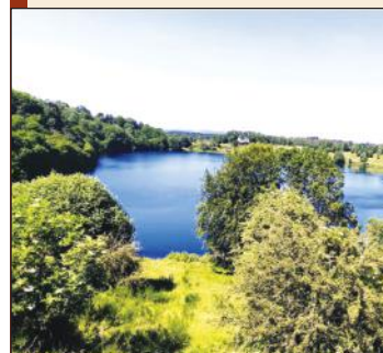
Экспонаты - реликтовые артефакты