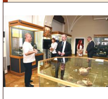
National Museum of Azerbaijan History, Embassy of Poland ink Memorandum of Cooperation