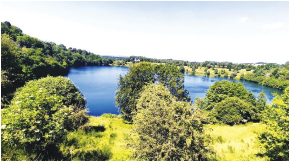
В настоящее время в 46 странах мира насчитывается в общей сложности 177 геопарков, единых географических территорий, где геологически значимые объекты и ландшафты управляются с использованием единой концепции сохранения, образования и устойчивого развития.

Глобальные геопарки признаны UNESCO уникальными объектами геологического наследия