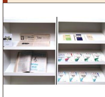
A scientific creative-meeting titled "Literary Process-2023" was held