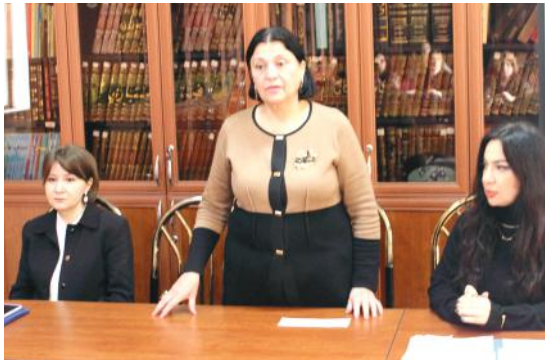
AMEA-nın akademik Ziya Bünyadov adına Şərqsünaslıq İnstitutunun şöbələrinin Elmi Şurasında illik hesabatları təqdim edilib.

Elmi şuranın iclaslarında institutun İran filologiyası, Ərəb filologiyası, Türk filologiyası, Cənubi Azərbaycan, İran tarixi və iqtisadiyyatı, Ərəb ölkələri tarixi və iqtisadiyyatı, Türkiyə tarixi və iqtisadiyyatı, Yazılı abidələrin tədqiqi və nəşri, Din və ictimai fikir, Şərqi-Qərbi, Mərkəzi Asiya, Asiya-Sakit okean regionu ölkələri, Şərqsünaslıq elminin tarixi və nəzəriyyəsi, Şərqi ölkələrinin tarixşünaslığı və Nəşriyyat və elmi informasiya şöbələrinin müdirləri illik hesabatları təqdim ediblər.