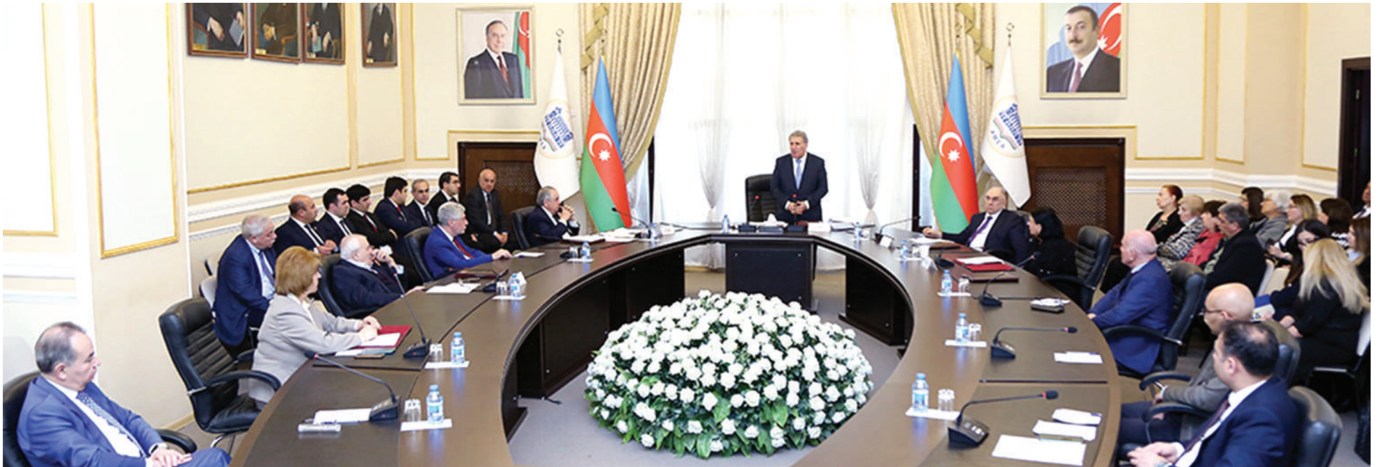
Azərbaycan Milli Elmlər Akademiyasının Rəyasət Heyətinin növbəti iclası keçirilib.