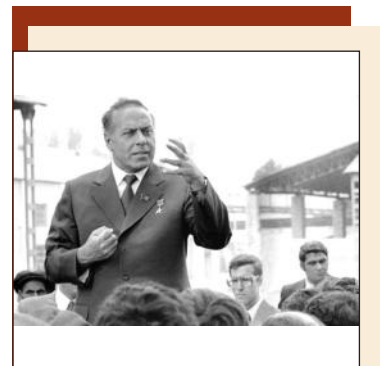
Личность планетарного масштаба

Президент НАНА сообщил, что наши ученые в рамках Года Гейдара Алиева систематически изучали широкомасштабную деятельность великого лидера и создали более 50 фундаментальных монографий, тем самым раскрывая академические основы изучения великого наследия Гейдара Алиева.