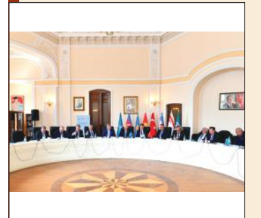
Наша семья - это тюркский мир