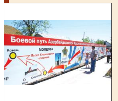
Особые боевые единицы