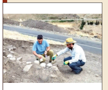
Совершенно обособленная наука