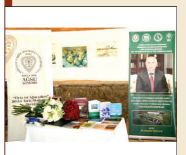
The issues of preparations for the 80th Anniversary of ANAS have been discussed