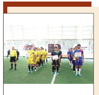
Спорт науке помогает