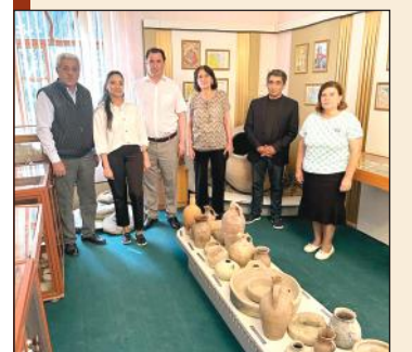
В преддверии Летней школы