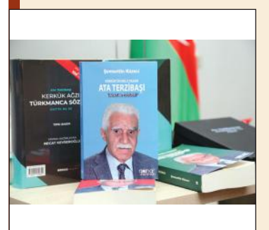
ANAS hosted the 100th jubilee of an esteemed figure Ata Tarzibashi