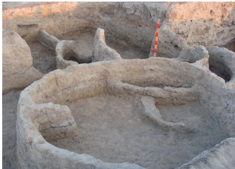
Neolit dövrünə aid yaşayış evlərinin qalıqları

- Начались они в 1947 году и продолжались до 90-х годов прошлого века. В Гобустанском археологическом комплексе было зарегистрировано порядка 20-ти древних стоянок от эпохи мезолита (XII тыс. до н.э.) до средневековья, более 6000 рисунков на 1000 скалах, до 40 курганов и т.д. В то же время здесь в погребальных памятниках VII-VI тыс. до н.э. были обнаружены человеческие черепа каспийского