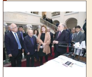
НАНА - важнейший партнер