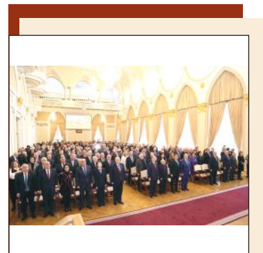
Создавая единый тюркский индекс