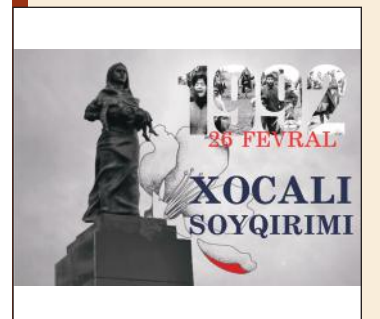
An event titled "The Khojaly Genocide and the present state of our sovereignty" was held at ANAS