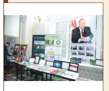
Ради достижения целей